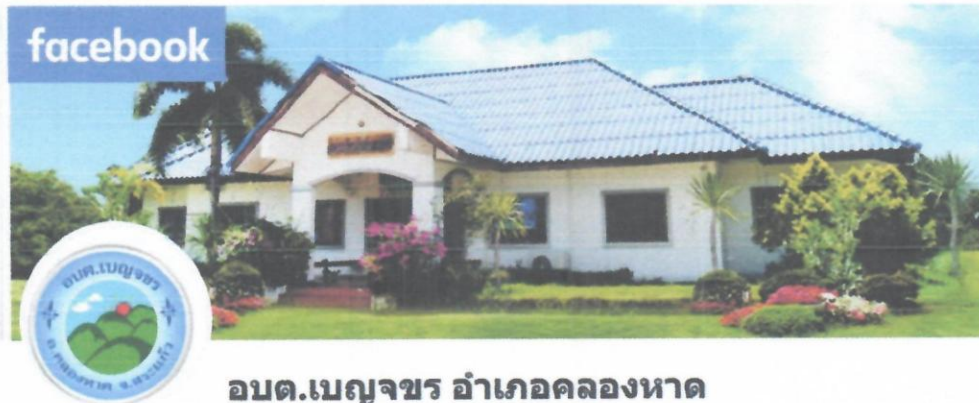
อบต.เบญจขร อำเภอคลองหาด

https://www.facebook.com/people/%E0%B8%AD%E0%B8%9A%E0%B8%95%E0%B8%90%E0%B8%9A%E0%B8%9D%E0%B8%9C%E0%B8%92%E0%B8%A3%E0%B8%AD%E0%B8%B3%E0%B8%80%E0%B8%A0%E0%B8%AD%E0%B8%84%E0%B8%A5%E0%B8%AD%E0%B8%87%E0%B8%AB%E0%B8%B2%E0%B8%94/๑๐๐๑๑๓๙๑๔๑๙๐๒๘/