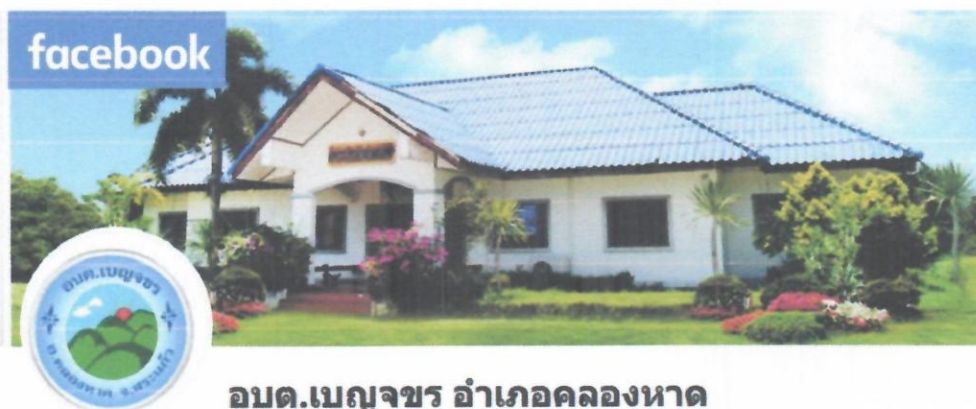
อบต.เบญจขร อำเภอลองหาด

https://www.facebook.com/people/%E0%B8%AD%E0%B8%9A%E0%B8%95%E0%B9%80%E0%B8%9A%E0%B8%8D%E0%B8%88%E0%B8%82%E0%B8%A3-%E0%B8%AD%E0%B8%B3%E0%B9%80%E0%B8%A0%E0%B8%AD%E0%B8%84%E0%B8%A5%E0%B8%AD%E0%B8%87%E0%B8%AB%E0%B8%B2%E0%B8%94/๑๐๐๑๑๓๙๑๔๑๙๐๒๘/